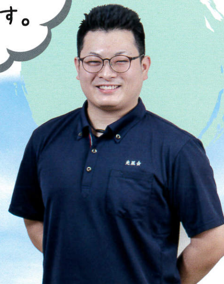
勤続1年目のケアワーカーさん

入社1年目ですが、先輩が仕事を丁寧に教えてくれるので不安なく楽しく、やりがいを持って働ける職場です。今では独り立ちし、自分自身の成長が実感でき、とても充実感を感じて働いています。