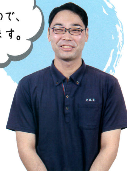
勤続11年目のケアワーカー(介護福祉士)さん

高卒で就職し、わからないことだらけのスタート。周りに恵まれたおかげでここまで頑張れました。仕事をしながら、介護福祉士の資格を取得しました。これからもチャレンジし続けます。ご利用者を思い、尽くし、最後まで寄り添うことが自分のやりがいです。