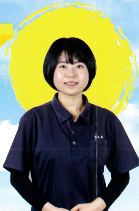
勤続2年目の看護師さん

「人の役に立つ仕事」がたくて、大学卒業時に社会福祉士を取得して就職しました。年の離れた上司、先輩も話しやすく、真面目に相談にのってくれます。福祉の社会の中での在り方や存在意義を学業として学んだことが、職場での行動や考え方に活かしています。