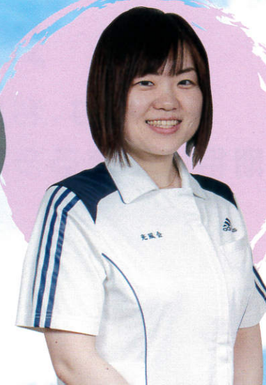
勤続4年目の理学療法士さん

2時間単位の有給休暇制度があり、用事を済ませたりできるので助かります。仕事は、生活に寄り添ったりハビリのお手伝いの中で、ご利用者の気持ちが前向きになったり、出来ることが増えたりすることが嬉しく、やりがいを感じています。